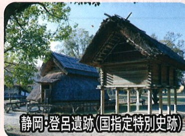
静岡・登呂遺跡(国指定特別史跡)