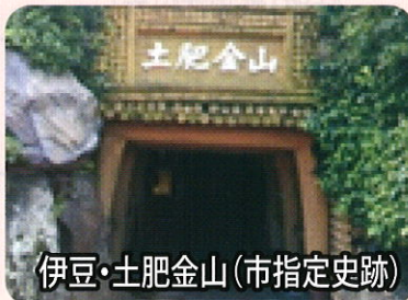
伊豆・土肥金山(市指定史跡)