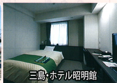
三島・ホテル昭明館